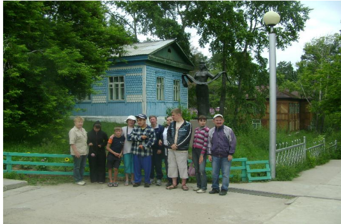
Мы с ребятами в Горячинске. До свидания Байкал, до свидания, лето!

Праздник Успения Пресвятой Богородицы под самый конец лета, а у нас в Сибири август – это почти осень, то есть по календарю лето, а по погоде – осень. Лето, короткое и яркое, промчалось, как будто его и не было, но оставило много впечатлений от поездок, походов и путешествий. Этот номер газеты посвящен полностью воспоминаниям ребят о поездке на Байкал в Листвянку и летнем отдыхе в экологическом лагере недалеко от Горячинска р. Бурятия.