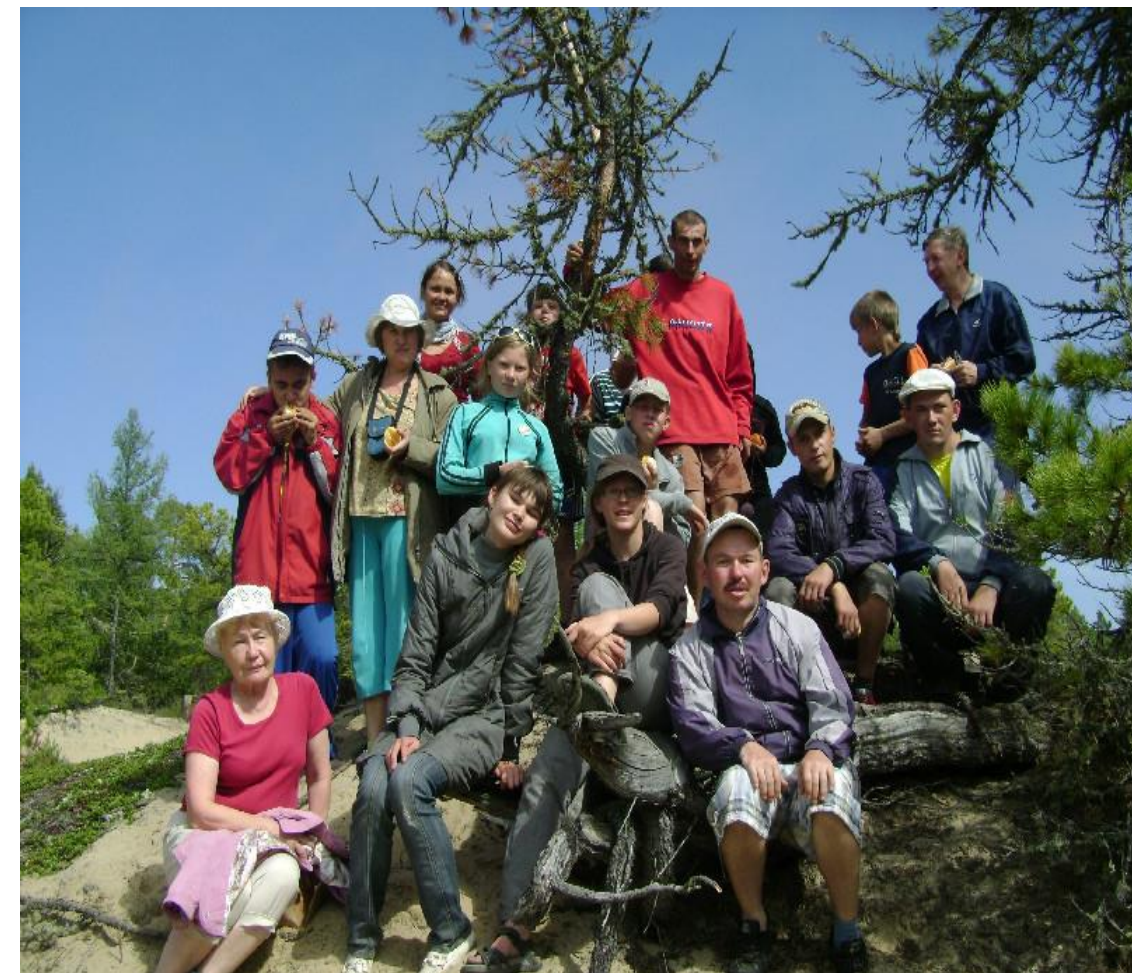
Фото: отдых после спортивного ориентирования в летнем лагере.