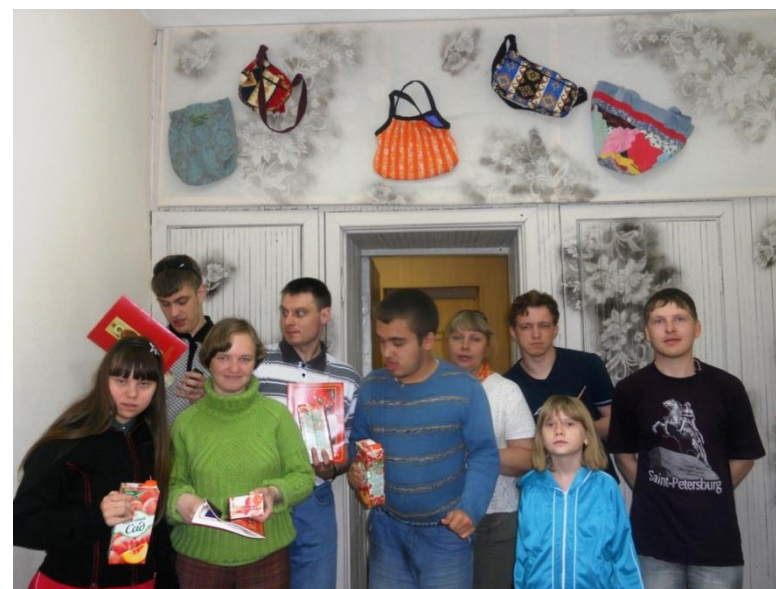
На фото: ребята собрались вместе в «Надежде». Впереди летние каникулы.