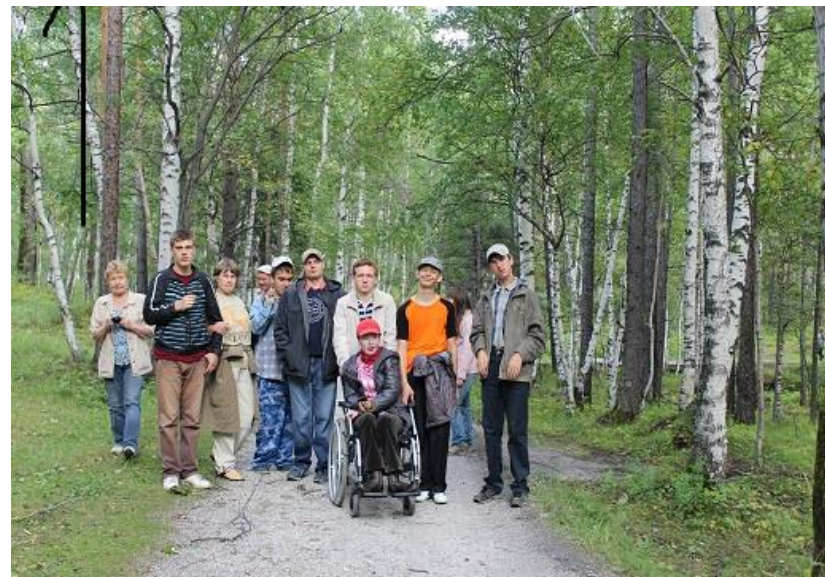
На фото: поездка в Аршан.